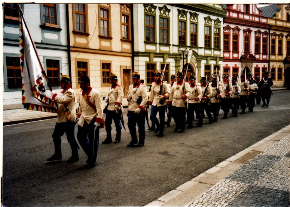
- pochod na slavnostní salvu