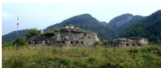
Pevnost Henschel na it.-sl. hranici

U Villachu se obě dálnice sejdou, načež pokračujeme směrem Tarvisio. Před ním se po překročení hranice nacházejí tunely. Přibližně mezi třetím a čtvrtým tunelem sjedeme vpravo do Tarvisia (označeno na vozovce) a dále pokračujeme podle směrových tabulí na Slovinsko (směr Bovec). Cesta stoupá vzhůru serpentínami do Cave del Predil a dále až do sedla Predil, kde se nachází slovinsko-italská hranice. Cca 200 m před první hraniční budovou v poslední zatáčce doleva se na pravé straně nachází malé parkoviště a pevnost z první světové války. Je sice prázdná, ale stojí za prohlídku. Vstup se neplatí a navíc se nám odsud nabízí nádherný výhled.