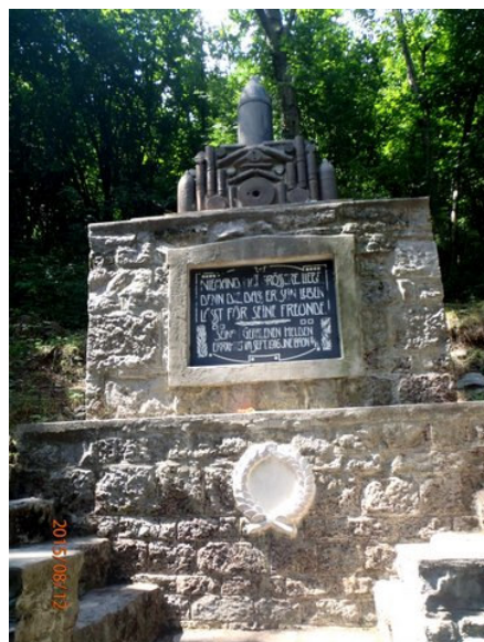
Hřbitov II/18 na Mrzlém vrhu

klesá (jsou na ní ještě asi dvě branky). Po její levé straně se vine ohradník. Posléze se dostaneme do lesíka. V něm bude z naší cesty viditelná pěšina doprava po vrstevnici, která mírně stoupá asi 50 m ke hřbitovu II/18 (levá klesá zase do Zatoľminu). Hřbitov lze nalézt také podle smrků, které u něho stojí, neboť většina ostatních stromů je listnatých. Podle nich lze už od sedla vyhlížet směr na zalesněném úbočí Mrzlého vrhu. Na zpáteční cestě se lze občerstvit na Kuhnju v turistické chatě, v níž je eventuálně možné se i ubytovat (má asi 25 míst) za asi 16 EUR. Hosté spí pouze ve dvou velkých pokojích, ale k dispozici je čisté sociální zařízení.