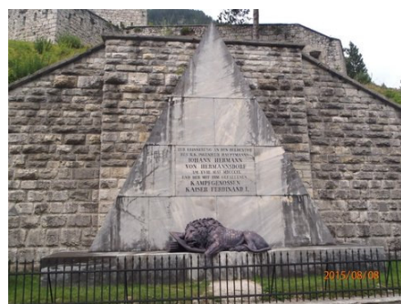
Pomník u pevnosti Hermann