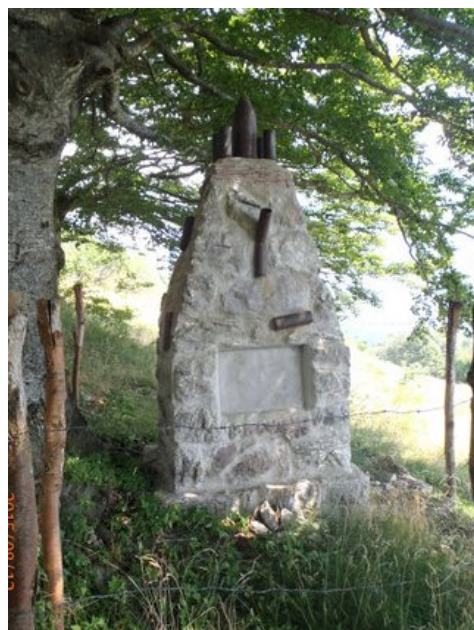
Hřbitov II/18 na Medrje